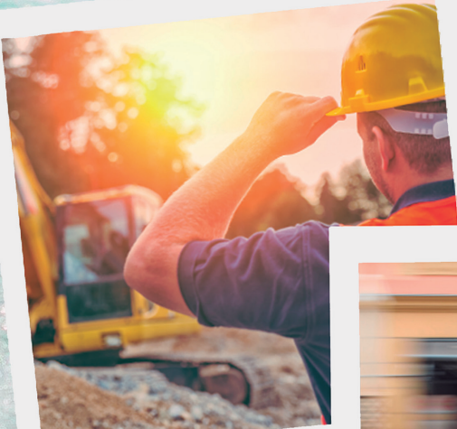
PRL vs cambio climático

Transiciones justas con empleo de calidad