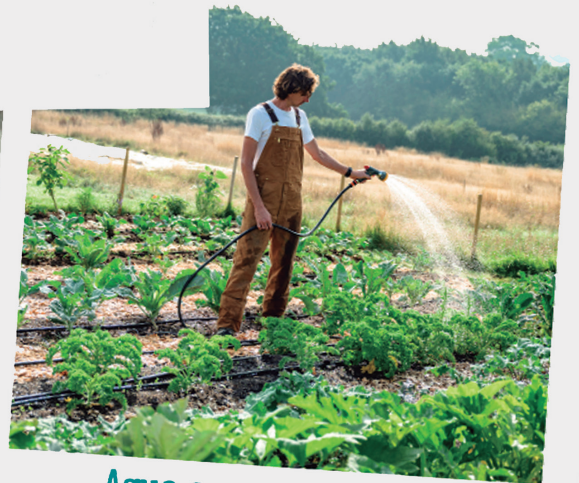
Agua como recurso público