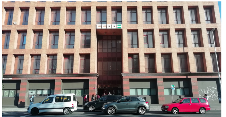
El edificio tiene un amplio vestíbulo y se divide en cinco plantas. La entrada principal es por la calle Cardenal Bueno Monreal.

accesibles para nuestros afiliados y afiliadas”, apunta De Los Reyes. El emplazamiento cuenta con múltiples opciones de acceso en transporte público (autobuses de Tussam, del Consorcio Metropolitano de Transportes y trenes de Cercanías) además de dos paradas de Sevici en los alrededores. Para llegar en coche privado,