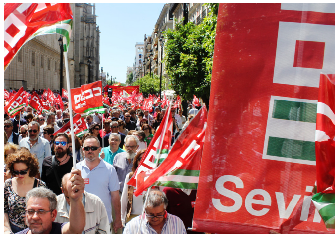
Imagen de archivo de la movilización del 1 de Mayo en Sevilla.

representativo en Sevilla, CSIF, tan solo obtiene el 6,47%.