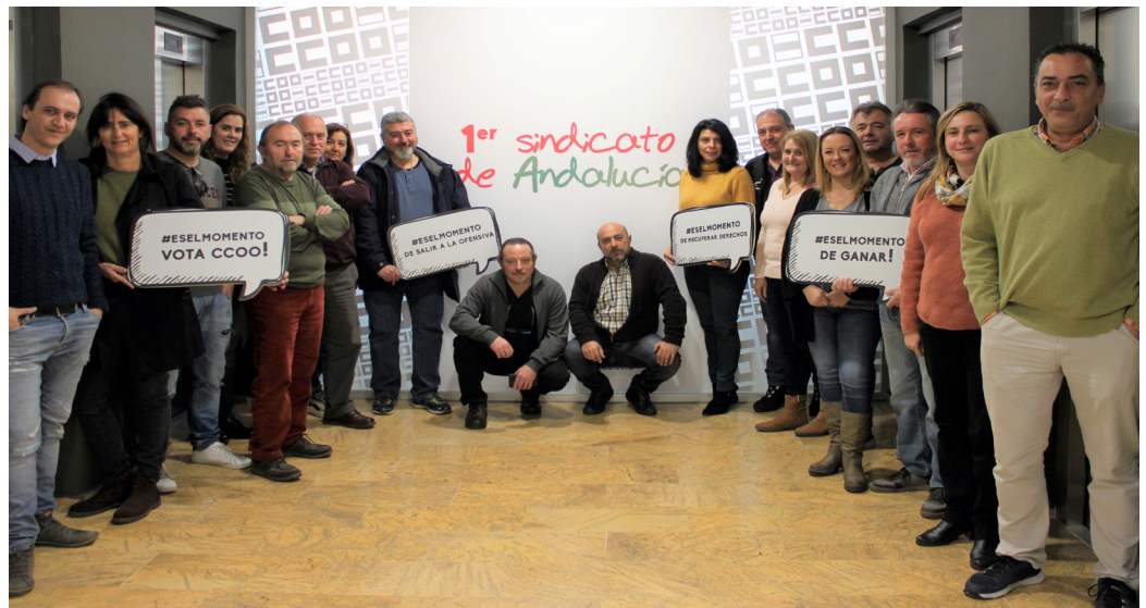
Foto de familia del equipo de elecciones sindicales de CCOO de Sevilla.

CCOO mantiene una representatividad que supera el 36%, lo que supone superar a UGT en prácticamente cinco puntos. Además, la diferencia entre los dos principales sindicatos de clase y el resto es abismal. CCOO y UGT suman en Sevilla más del 68% de los delegados y delegadas; mientras que el tercer sindicato más