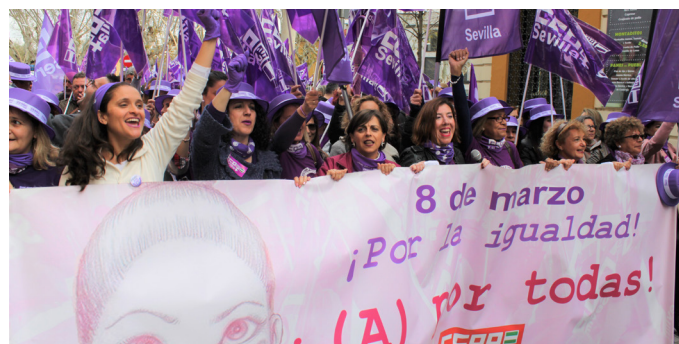
Compañeras sindicalistas en la manifestación del pasado 8 de marzo.

El crecimiento durante el 2019 en el sindicato ha sido de más del 4%, y el mayor aumento se ha producido entre los menores de 35 años, lo que demuestra que “el sindicalismo de clase goza de buena salud y